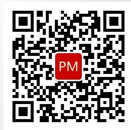
产品经理深入浅出微信二维码